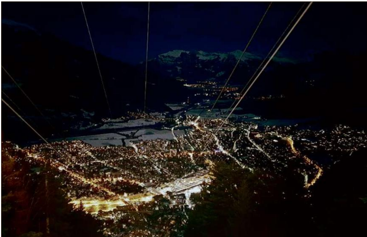
Vesta sur il marcau da Cuera situau amiez il contuorn muntagnard.