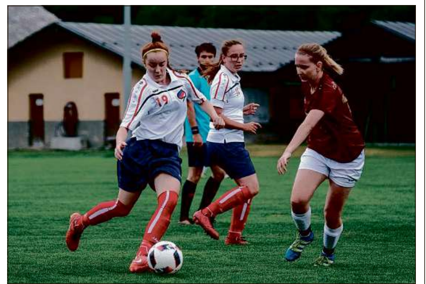
Il CBR tschertga anc giugaduras e giugadurs.