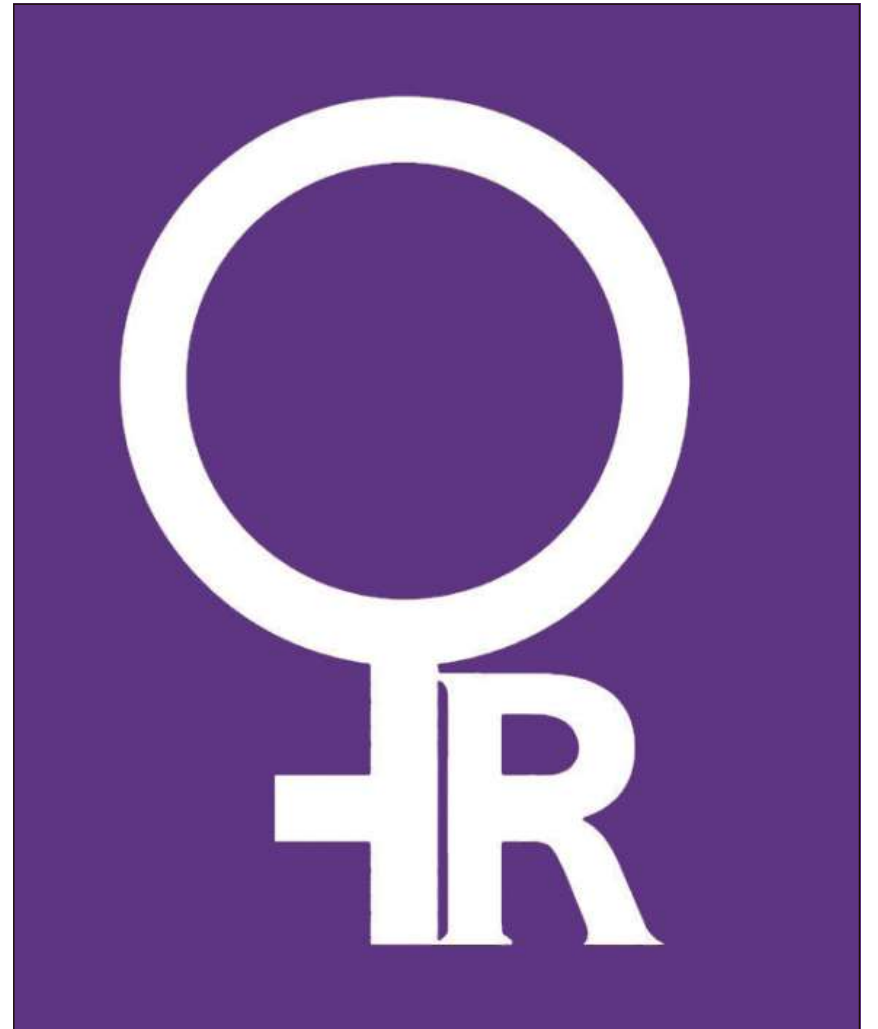
Il logo da las dunnas* rumantschas.